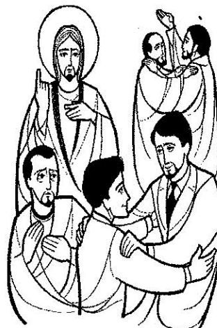
Amad a vuestros enemigos 7º DOMINGO DEL TIEMPO ORDINARIO

Séptimo Domingo Tiempo Ordinario 19 de febrero de 2017 CICLO A